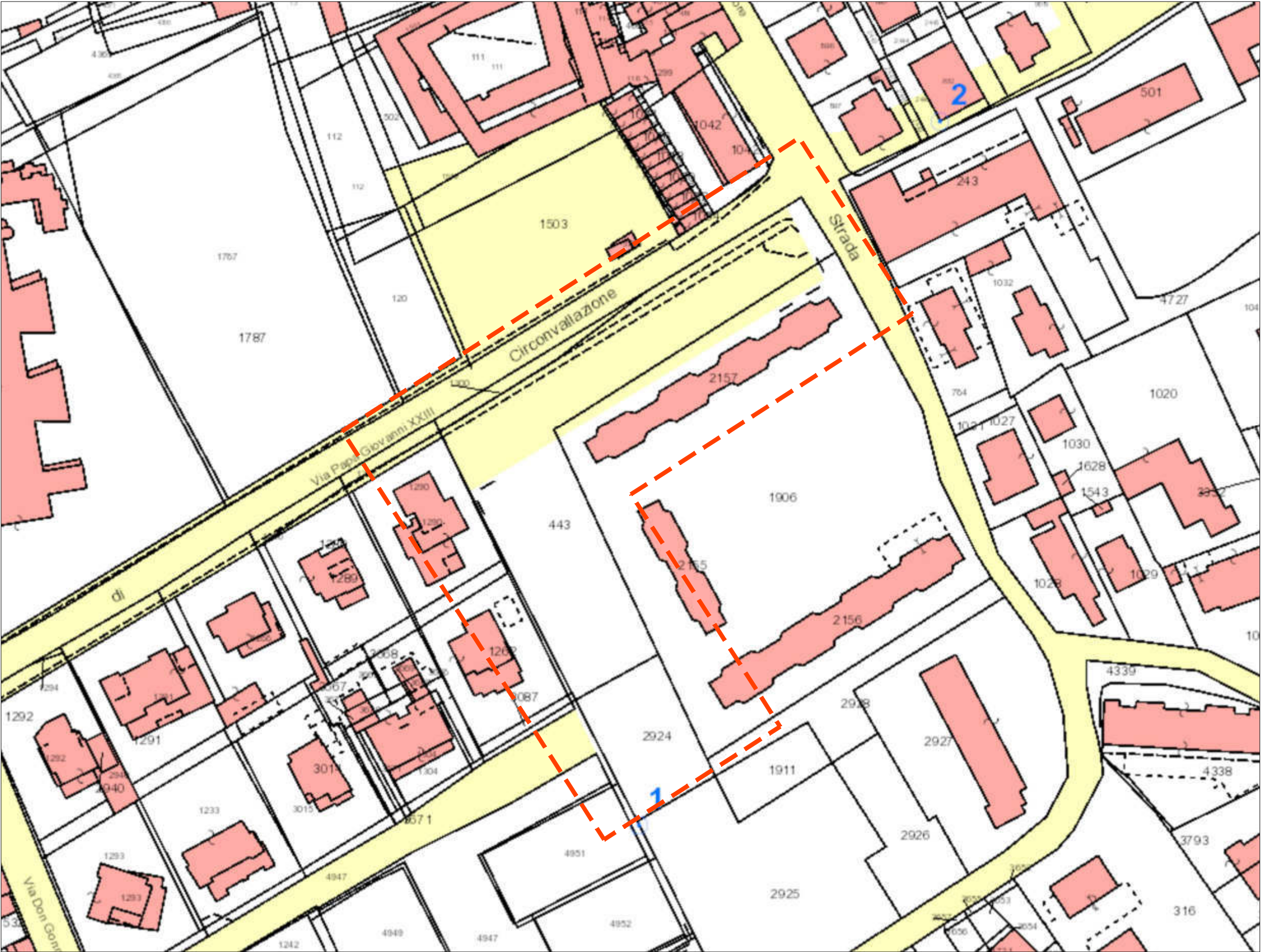
Estratto mappa catastale