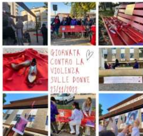
collaborazione con il progetto giovani (allestimento piazza)